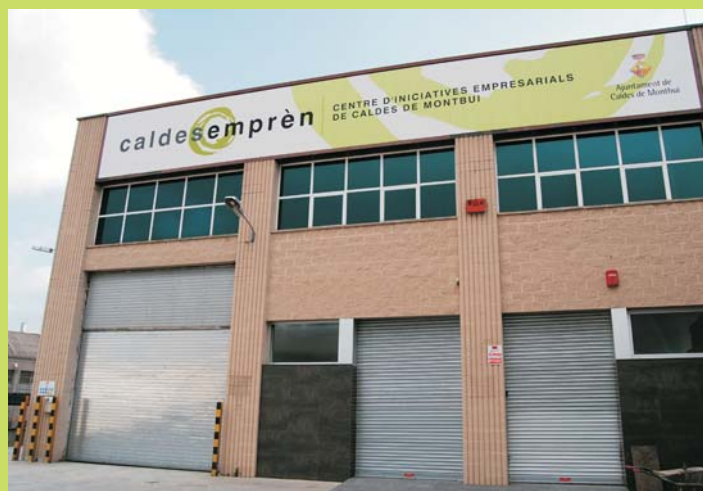
Façana exterior de Caldes emprèn, Centre d'Iniciatives Empresarials

Caldes emprèn. Centre d'iniciatives empresarials és el nom del nou equipament situat al polígon de la Borda i que s'ha convertit en un espai municipal d'ençà que l'Ajuntament va adquirir la nau del Sindicat. La inauguració del centre tindrà lloc el dimecres 23 de març, a les 19 h, en un acte adreçat a la ciutadania en general i al sector empresarial i emprenedor de Caldes en particular.