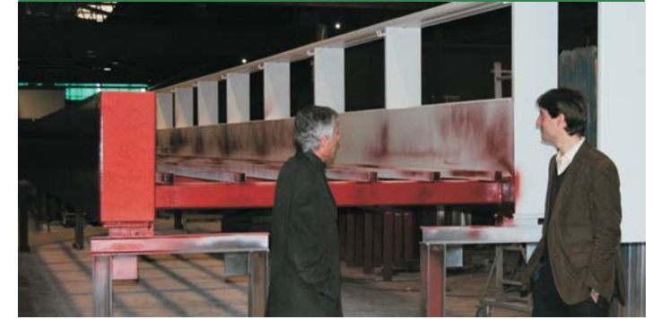
La passarel·la del Remei, en construcció

Una de les actuacions que culminaran l'obra de millora del passeig del Remei és la passarel·la que s'ha començat a construir a mitjans del mes de febrer. Aquesta obra, que s'afegeix a les millores fetes gràcies al Fons Estatal d'Inversió Local de l'any 2009 ha provocat que el passeig resti tancat també durant el mes de febrer al trànsit rodat. La passarel·la és una connexió que salva la corba del Remei direcció la C-59 i direcció la carretera d'accés al Farell per l'interior del torrent. Amb aquest pont per a vianants s'afegeix un recorregut per fer a peu fins ara inexistent en la zona. La manca de voreres i l'estretor de la carretera de sortida del municipi des del Remei ha estat una dificultat per al passeig i per als recorreguts dels caminants direcció el càmping i l'entorn natural de la muntanya.