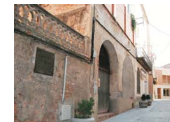
Pàg. 4 i 5 L'antic safareig "La Piqueta" acollirà el Club de l'Emprenedor