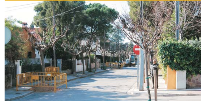
Segona fase de millores de l'enllumenat públic de Caldes de Montbui

Les obres d'adequació de l'enllumenat iniciades el febrer afecten els barris de Catalunya i, parcialment, Camp de l'Arpa. La segona fase té un pressupost de 197.9998,08 € i ha comptat amb l'ajut de la Diputació de Barcelona. El projecte té dos objectius principals: la reducció del consum energètic i la reducció de la contaminació lumínica. Aquesta actuació s'enmarca dins d'un pla de renovació de les instal·lacions d'enllumenat al municipi establert per l'Ajuntament per poder substituir aquelles llumeneres que actualment tenen més deficiències en el rendiment lumínic i energètic. El pla contempla actuar sobre les instal·lacions més crítiques en l'aspecte del consum energètic.