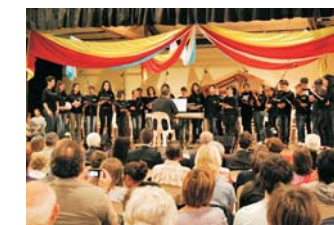
Pàg. 4 Caldes i Saint Paul Les Dax són pobles germans